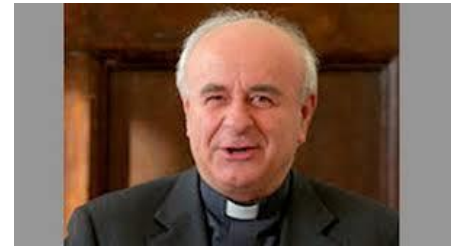
Monseigneur Paglia (Conseil Pontifical pour la famille)

menait dans un hôpital de la ville. D'après elle, c'est son mode vie sain qui lui offre une si longue existence. Elle ne fume pas et n'a jamais appris à conduire, si bien qu'elle a beaucoup marché !